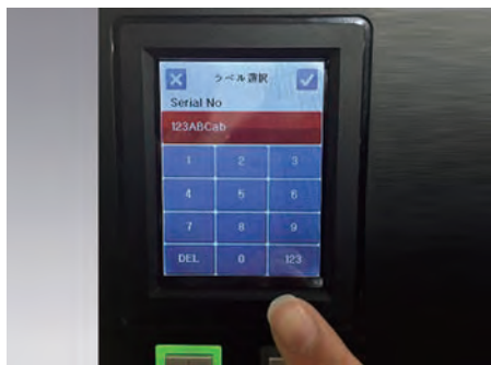
タッチパネルで直接データ入力