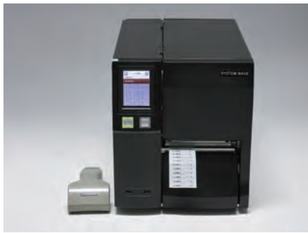
Bluetoothスキャナーによるデータ入力