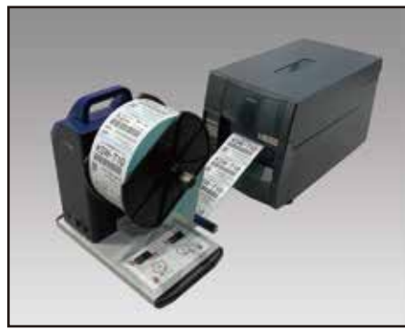
● ラベル巻取り機 (KSW-T10)