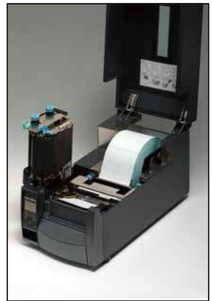
● ラベルセットが簡単なフロントオープン機構