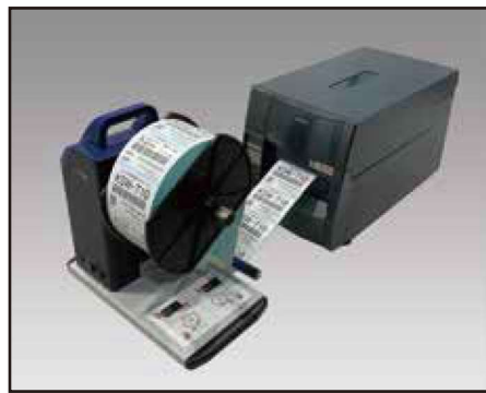
● ラベル巻取り機 (KSW-T10)