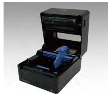
ラベルセットが簡単な全面オープン機能