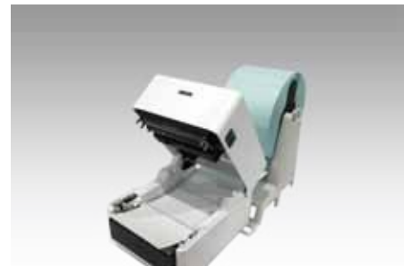
ラベルセットが簡単な全面オープン機能