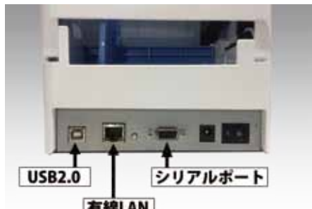
標準インターフェイス