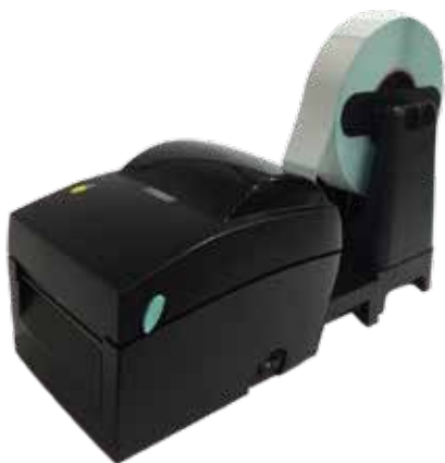
外部ロールホルダー(KSW-LH120)

プリンタはコンパクト、ラベルは大型ラベルを使用したいという要望にお応えしました。